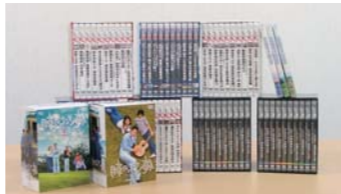
▲奈良少年院にDVD10セット84巻