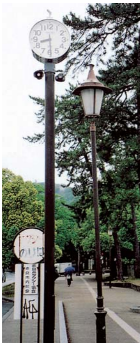
▲奈良公園に太陽電池時計