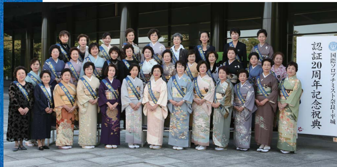
奈良県新公会堂 2007年10月12日

明るい未来を創りましょう — 女性と女兒に光と夢を — Strive for Hopeful Future! — Light and the dream to the woman and the girl —