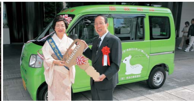
▲「奈良の鹿愛護会」に四輪駆動車贈呈