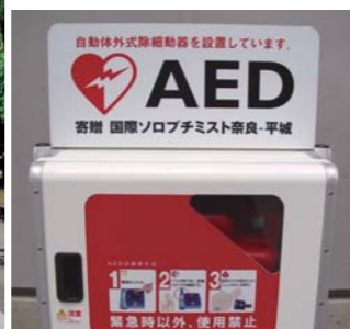
▲奈良市内6ヶ所にAED設置