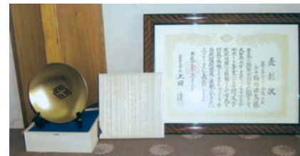
▲大和郡山市「まちづくりアイデアサポート基金」