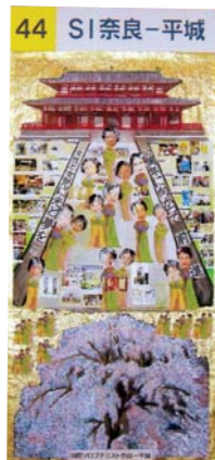
リジョン大会ポスターセッション作品